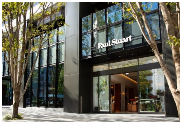
Paul Stuart 青山本店

新型コロナウイルス感染拡大に伴い営業時間は当面の間11:00~19:00、 BAR The Copper Room 14:00~20:00(※ラストオーダー19:00)