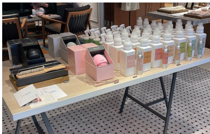
「Paul Stuart 青山本店」コリドー(回廊) [COVA] (左) [LIVRER YOKOHAMA] (右) POP-UPの様子