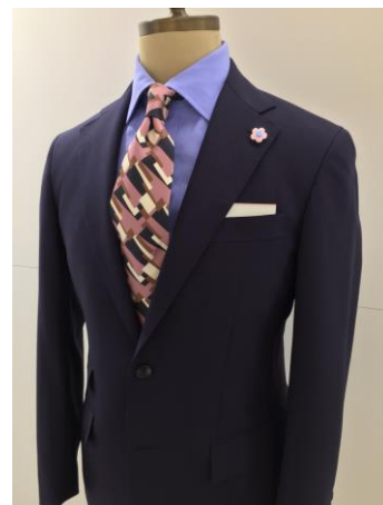
ポール・スチュアート(紳士服)