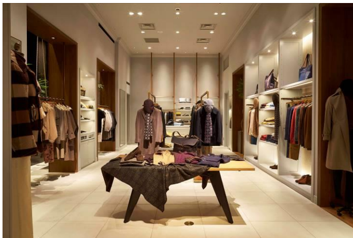
モダンで明るい雰囲気のカジュアルルーム