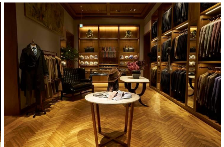
ジェントルメンズクラブのような重厚感あるテーラードルーム