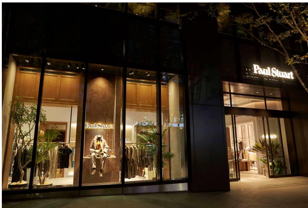
「ポール・スチュアート 青山本店」 外観

※2020年11月5日付にて「Paul Stuart青山店」から「Paul Stuart 青山本店」に名称変更いたしました。