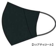
【トップチャコール】