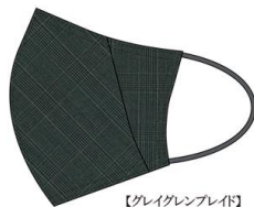
【グレイグレンブレイド】

男性の横顔を端正に見せるカッティングワークと顔周りに適度なフィット感を与える立体裁断。表地に芯貼りを施した優れた保形性と裏面にジャージーを配した柔らかな肌触りで、顔周りをすっきりと見せつけ心地も良いのがポイント。ビジネスやフォーマルなシーンでも合わせやすい色と素材感でギフトにもおすすめです。マスクの売上の一部を、ひとりじゃないよPJの活動に賛同し、困窮が顕在化して問題になるといわれている世代や家庭を支援する団体へ寄付いたします。