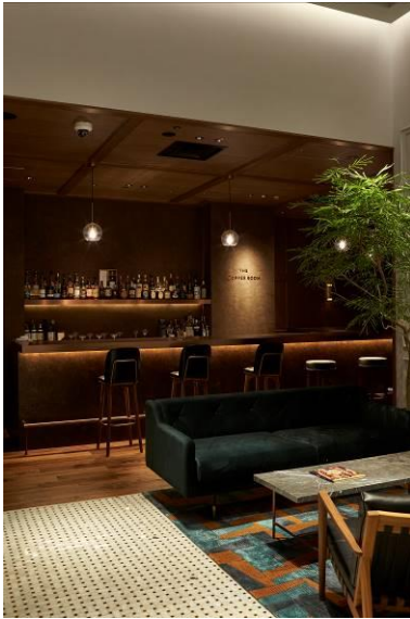
店内奥に併設されたBar 「The COPPER ROOM」