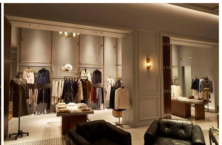
洗練された空間のウィメンズ