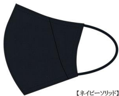
【ネイビーストライプ】