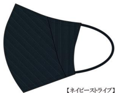
【ネイビーストライプ】