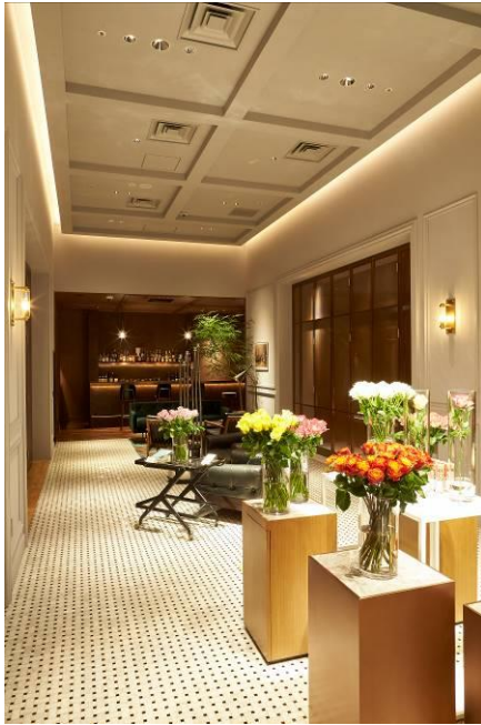
「モダン コロニアル」をイメージした タイル使いのコリドー

ズは居心地の良い洗練された空間をイメージしながら、ブランドでは女性客からもオーダーが多いことから国内で初めてオーダー専用のフィッティングスペースを設置。ウィンドウやフィッティングルーム、Barにはアメリカのニューヨーク本店やワシントン店でブランドの象徴的な店装として使用している” THE Wall(ザ・ウォール)” という錆加工した銅板と連動した装飾に。Barの名称「The COPPER ROOM (ザ コッパー ルーム)」の「COPPER」も銅という連想から付けています。