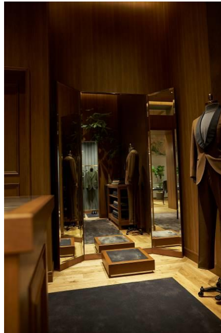
ラグジュアリーホテルの一室のような フィッティングルーム