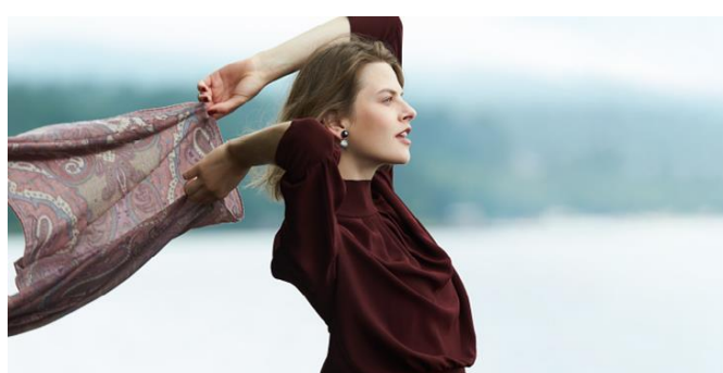
(写真/2020年秋冬シーズンビジュアル)

グローバルな感性を持った大人に向けて、トレンドに左右されことなく自分自身のライフスタイルに合わせてパーソナリティーが表現できるスタイリングを提案する「コンテンポラリー・クラシック」ブランド