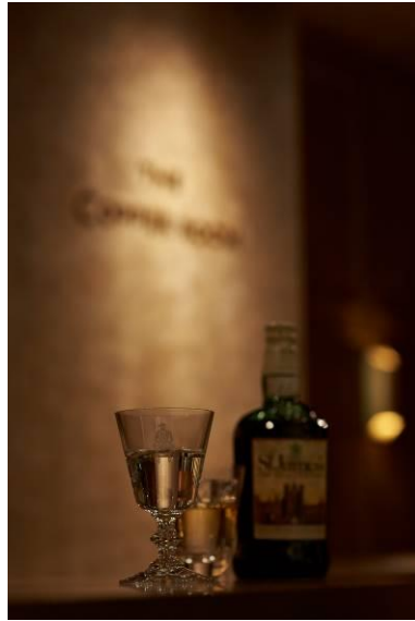
オリジナルグラス 水を入れるとブランドアイコンである " Man On The Fence" が水面に 座っているように見える

店舗の奥では「ポール・スチュアート」がターゲットとする大人たちが集う落ち着いた空間として、国内で初めてのBar「The COPPER ROOM (ザ コッパー ルーム)」を併設。ニューヨークにちなんだオリジナルレシピのカクテル" Manhattan (マンハッタン) "を中心に、希少なウイスキーを数多く揃え、ブランドオリジナルのチェイサーグラスも用意し大人の遊び心を演出。「ポール・スチュアート」の世界観を体感できる空間として提案いたします。