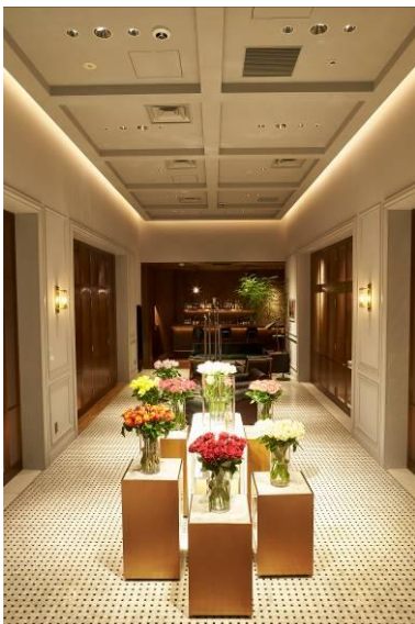
コリドー（回廊） POP-UPスペース

コリドー（回廊）は、シーズナルなオケージョンに合わせてイベントやPOP-UPスペースとして活用を予定。