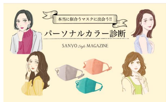
SANYO Style MAGAZINE「カラー診断」ページ