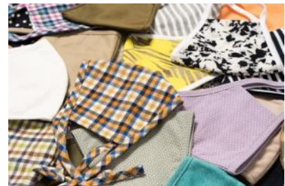
オリジナル布製マスク第4弾（ユニセックス）

オリジナル布製マスクは、第1弾として白無地1種類を5月に発売し1時間で完売、第2弾では色や柄を豊富に揃え16種類を6月に、第3弾として9種類の新色新柄を7月に発売し、ともに数日で完売となりました。マスク着用が 新たな生活様式 のひとつとなり、マスクが ファッション のひとつとして取り入れられるようになったことから、 第4弾では秋冬シーズンに向けて25種類の色や柄 をご用意し、数量限定で発売いたします。