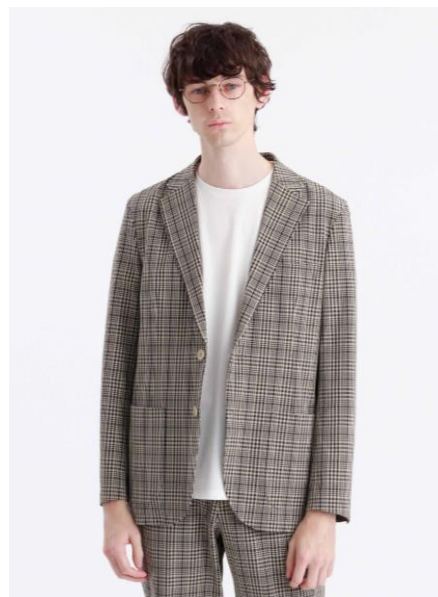
2020年発売の新モデル “ボックス ジャケット”