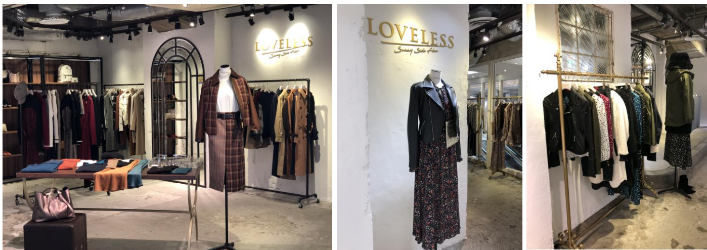
池袋パルコ本館2階ポップアップショップ

三陽商会が展開するセレクトショップ「ラブレス」は、2018年秋冬より出店をスタートした「LOVELESS Sunny Side Floor（ラブレスサニーサイドフロア）」のポップアップショップを、池袋パルコ本館2階に9月12日にオープン、2月11日までの約5カ月に亘り展開いたします。「ラブレス」としては初となるウィメンズのみを扱うショップとして、LOVELESSのオリジナルブランドに加えて、今季より取扱いをスタートするロンドン発エコファーストブランド「jakke（ジャッキー）」のアイテムを先行発売いたします。