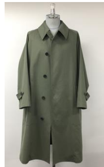
「UKアーミーステンカラーコート」

メンズ 想定上代：¥69,000+税 定番のUSアーミーPコートをベースに肩回りを立体的に構築する身返し設計を採用し、テラーメイドのような雰囲気を加えた。