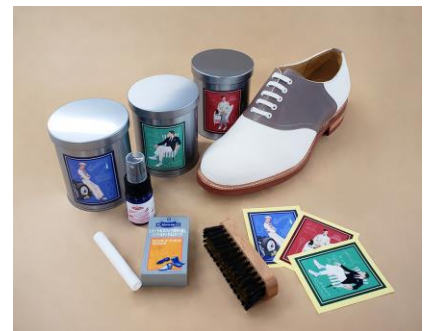
シューケアセットイメージ

展開店舗 : ・日本橋高島屋S.C. (新館) 店、 ・東京ミッドタウン日比谷店、 ・玉川高島屋S・C、 ・伊勢丹新宿店、 ・松坂屋名古屋店、 ・SANYO iStore (サンヨー・アイストア) https://sanyo-i.jp/s/b/sanyoyamacho