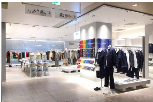
MP STORE 二子玉川ライズS.C.店 (9/21 OPEN)

三陽商会が展開するブランド「マッキントッシュ フィロソフィー」は、都市型商業施設に向けたライフスタイルストア「MP STORE（エム ピー ストア）」の本格出店を今秋冬よりスタートいたしました。同ストアは、紳士服・婦人服で共通の素材やデザインを使用したユニセックスなデイリーカジュアルウエアに加え、ステーションナリーやテーブルウエア、トラベルグッズといった生活雑貨、サブライセンシーアイテムである傘や腕時計、靴下などの服飾雑貨を取り揃え、20代から30代を中心とした都市型生活者に向けて提案します。今秋は、9月21日（金）二子玉川ライズS.C.に続いて、9月26日（水）にルクア大阪、10月5日（金）に名古屋パルクにオープンいたしました。