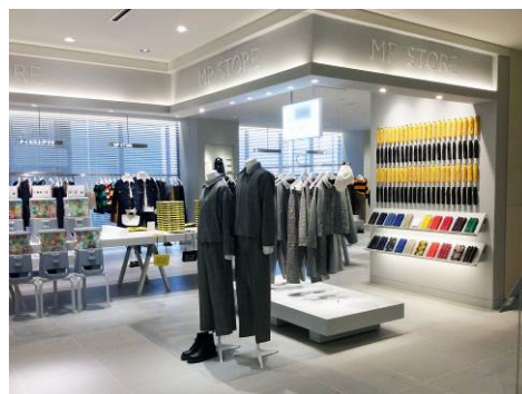
MP STORE ルクア店 (9/26 OPEN)