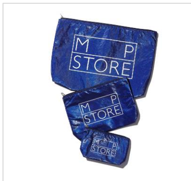
二子玉川ライズS.C.店限定カラー ブルー

3店舗のオープンに合わせて、カラー限定商品を企画いたしました。「MP STORE」で人気のサコッシュやポーチで、二子玉川ライズS.C.店はブルー、ルクア店はイエロー、名古屋パルク店はゴールドを店舗限定で販売しています。