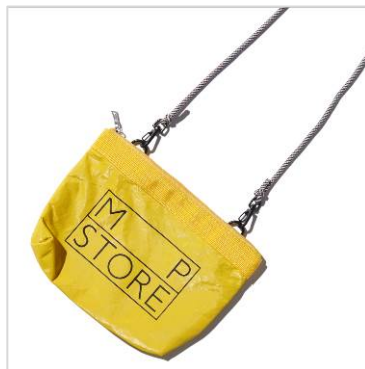
ルクア店限定カラー イエロー