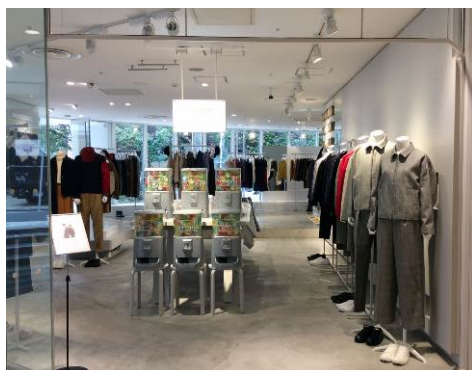
MP STORE 名古屋パルク店 (10/5 OPEN)