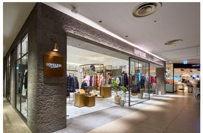
「ラブレス サニーサイドフロア 新宿フラッグス店」