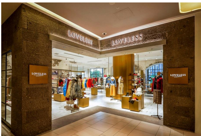
「ラブレス サニーサイドフロア グランフロント大阪店」

三陽商会が展開するセレクトショップ「ラブレス」は、明るく洗練された空間が特徴のニューストア「ラブレス サニーサイドフロア」を、東西のターミナル駅に隣接する複合商業施設「グランフロント大阪」と「新宿フラッグス」に10月5日（金）にオープンいたしました。