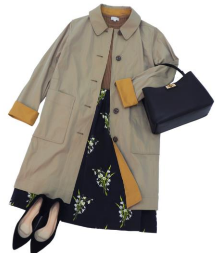
婦人服「マッキントッシュ フィロソフィー」 リバーシブル仕様の「花粉プロテクトコート」