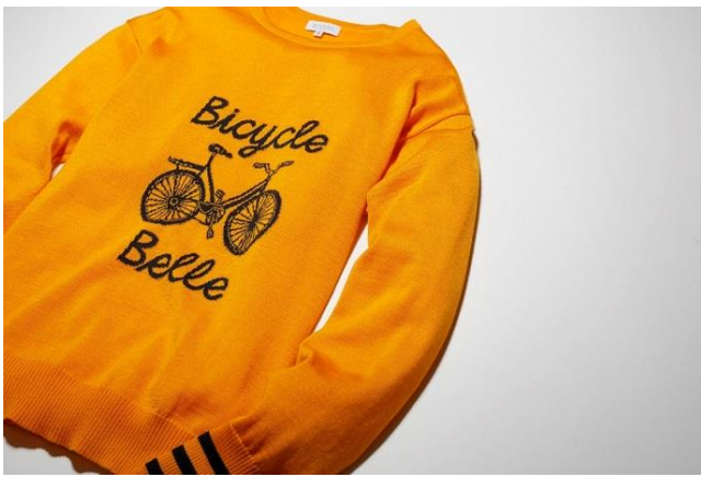
ジャカードニット 本体価格¥19,000+税

フェア期間中、30,000円(税抜)以上お買い上げのお客様に先着でオリジナルキーホルダーをプレゼントいたします。