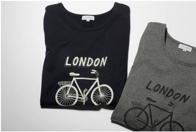
半袖プリントTシャツ 各 本体価格¥7,900+税