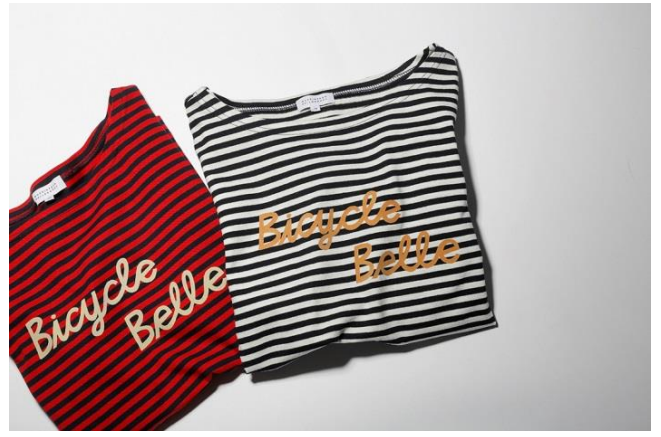
長袖プリントTシャツ 各 本体価格¥9,900+税