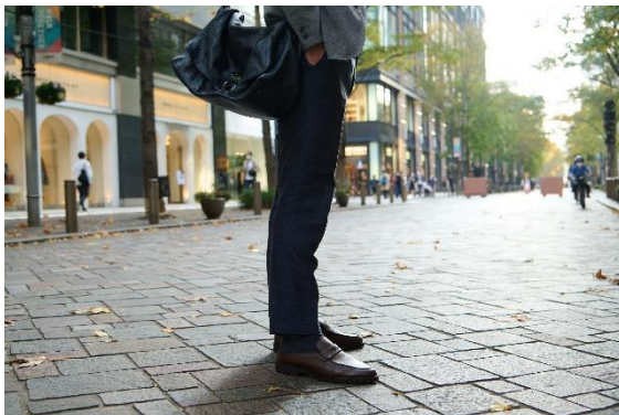
スーツに合わせても違和感のない上質感

オフィススタイルもリラックス傾向にある今、きちんと感とラフ感を両立したローファースリッパが、ニューノーマルなライフスタイルにマッチします。