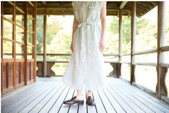
ヒールレスでもワンピースを綺麗に