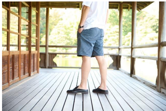
近所の買い物や散歩でもさっと履いてきまる