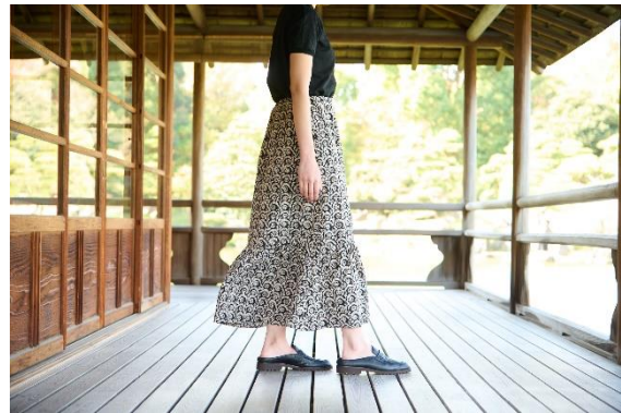
スカートと合わせても大人っぽい