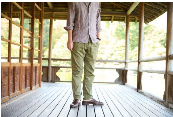
麻シャツに合わせた大人の休日スタイル