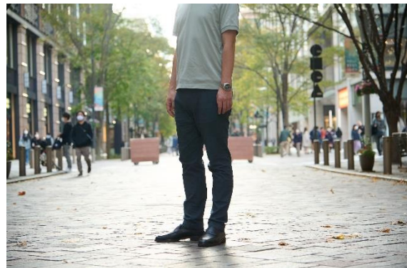
春夏の職場やカフェでのテレワークも爽やかに