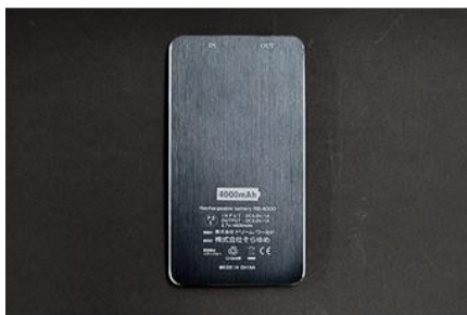
裏面には性能等を表示