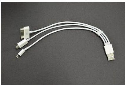
USB対応の三又コネクタ付属 ※仕様変更となる場合がございます