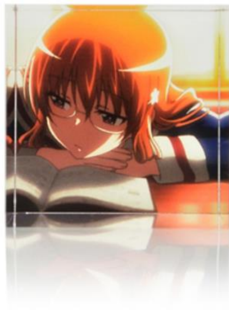
紅緒イラストイメージ