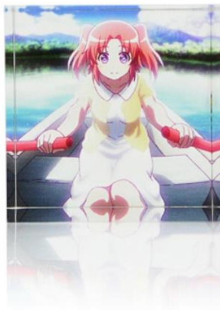
小紅イラストイメージ