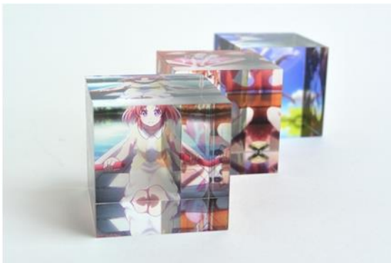
透明度が高いアクリルのため背景が透けます