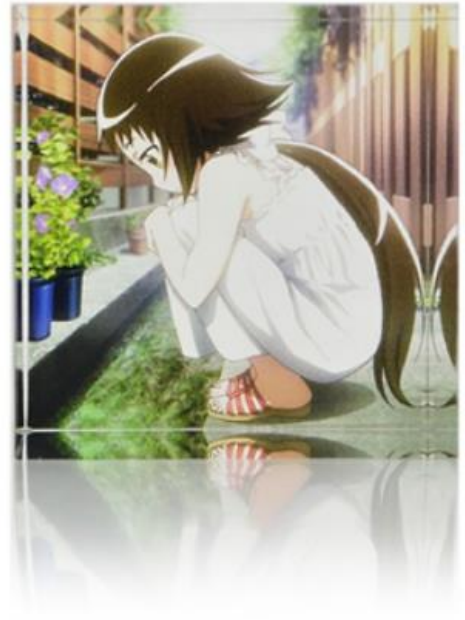
真白イラストイメージ