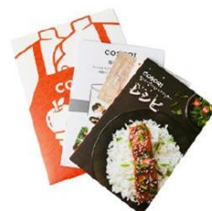
専用レシピと 取扱説明書