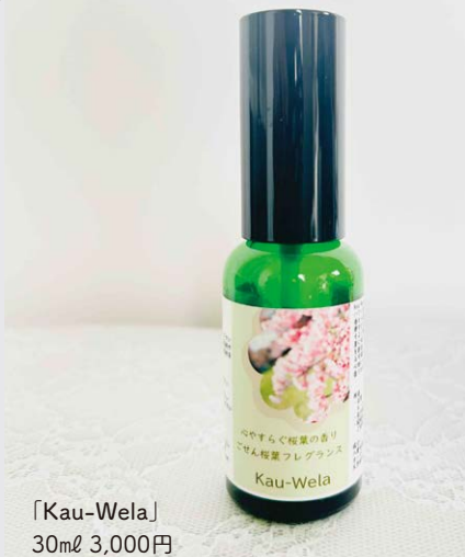
「Kau-Wela」 30ml 3,000円