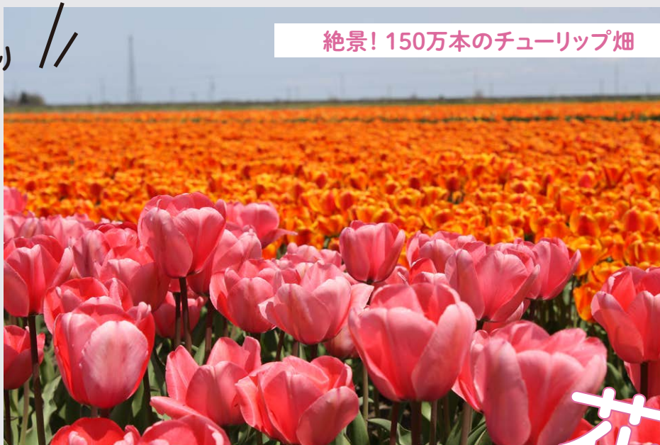
絶景! 150万本のチューリップ畑