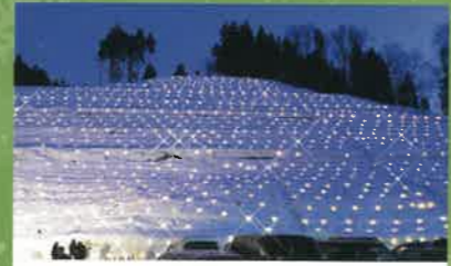
⑦ほくほく大島駅会場

大島庄屋の家に「雪あそび広場」を開設します。「雪あそび広場」はお昼から開設し午後3時頃には「餅つき」を行います。また「ブナ林かんじき散策」も予定しています。雪たっぷりの旭地区で存分に遊びましょう。