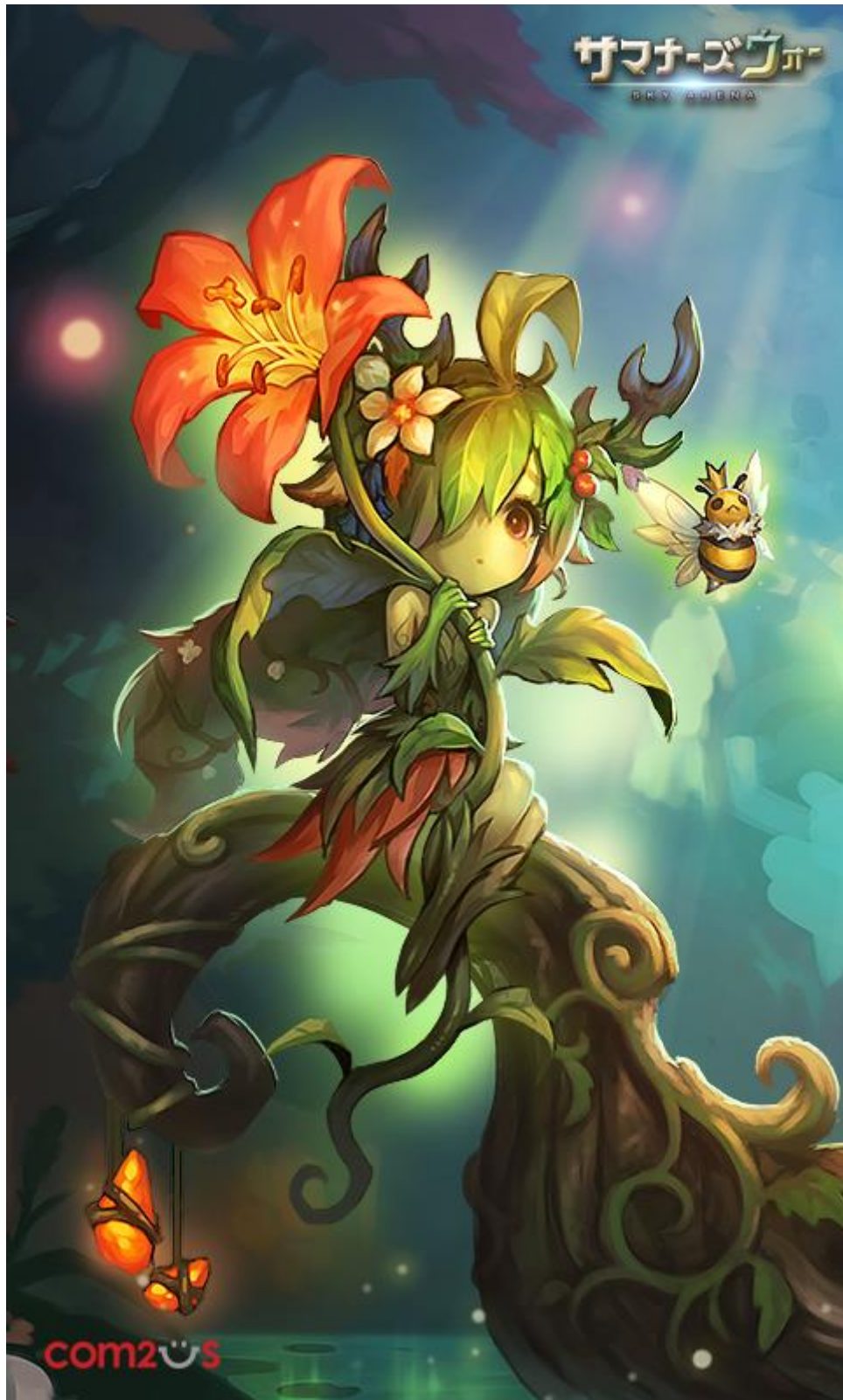
▲愛らしいで立ちの純正星4 モンスター「ドリアード」