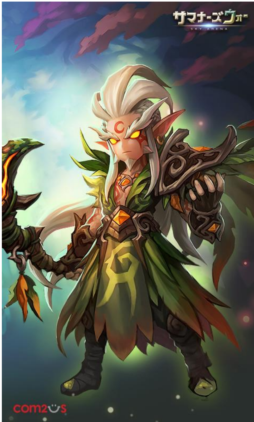
▲凛々しく強大な力を秘めた純正星 5 モンスター「ドルイド」