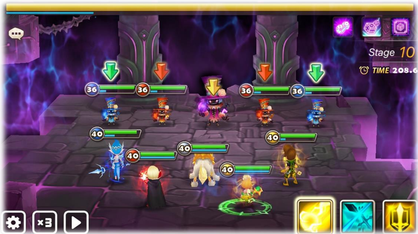
▲タイムアタック形式のステージ