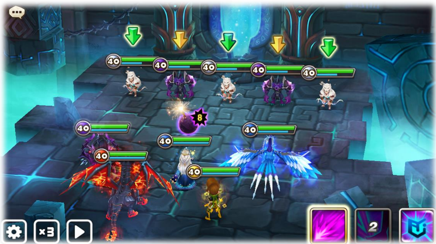
▲爆弾を押し付け合うボンバーモードステージ