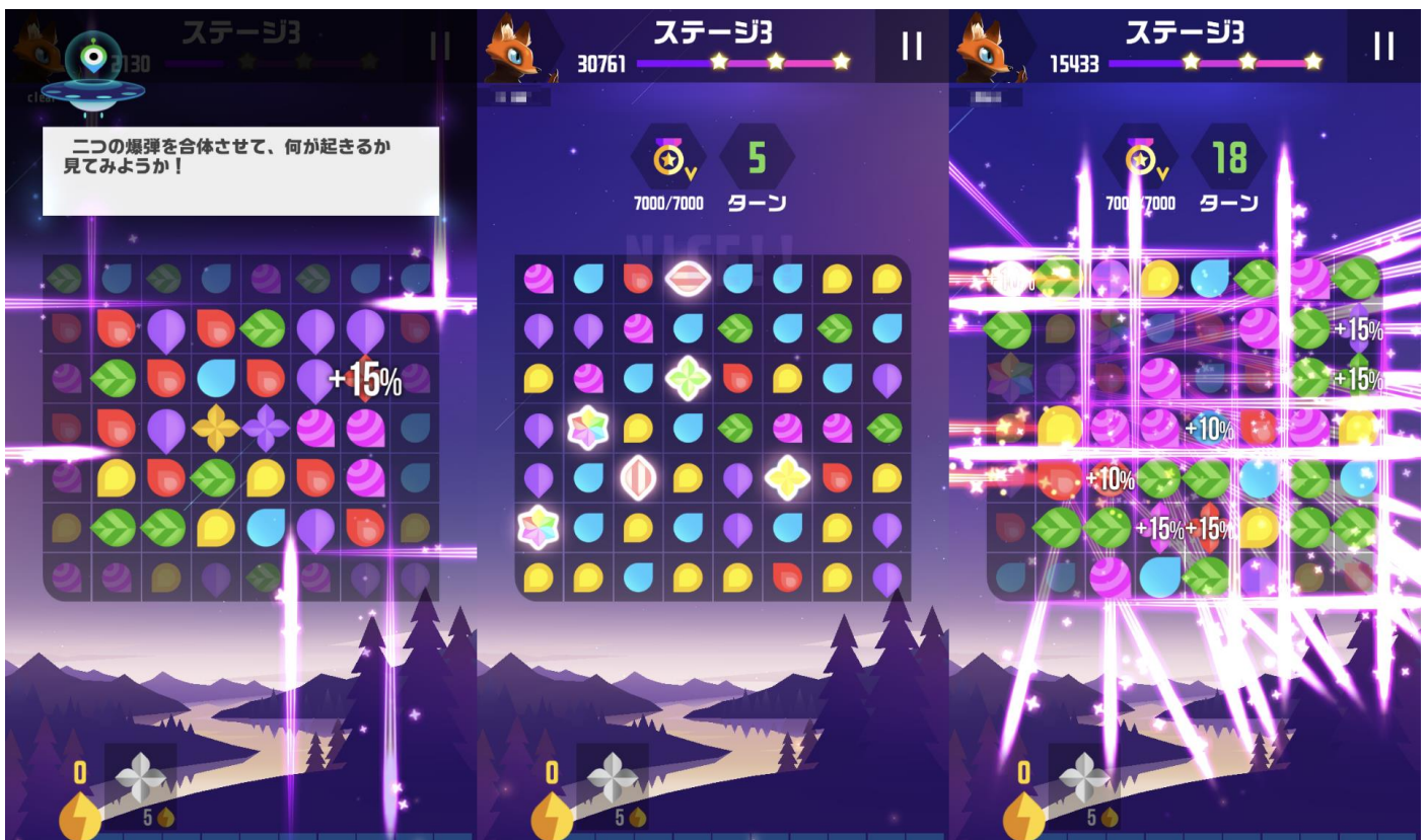
▲ナビゲーターの指示に従って爽快な大爆発を経験しよう!