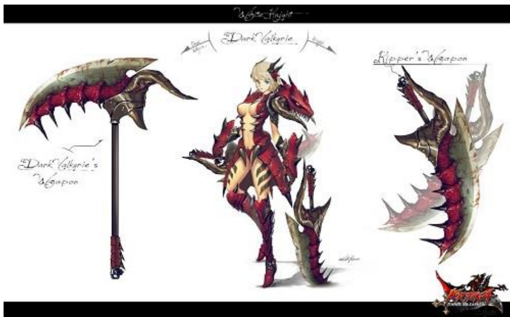
新作アバター「ドラゴンスレイヤー」セット

これからもお客様のご要望に応え、より楽しく安心できるサービスを提供してまいります。 是非、をお楽しみください。