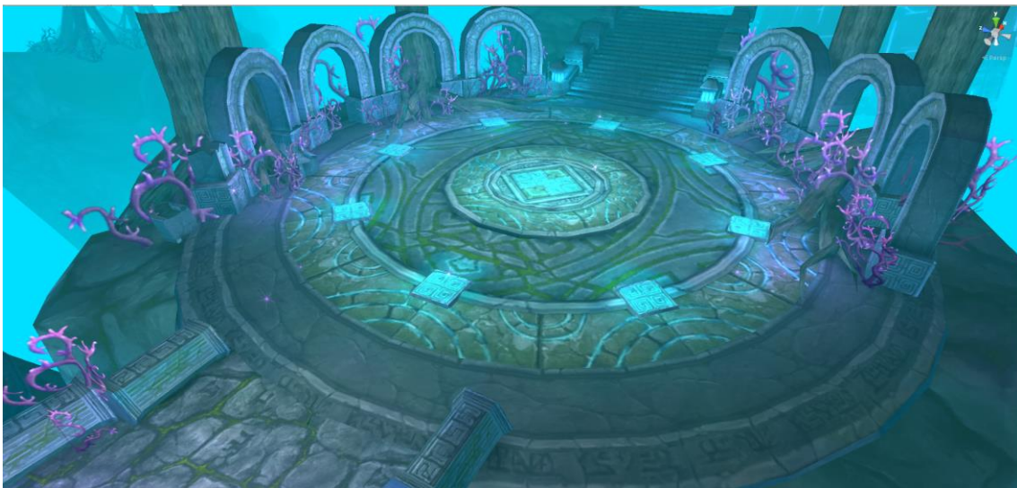
新エピソード「ハリダリムの遺跡地」