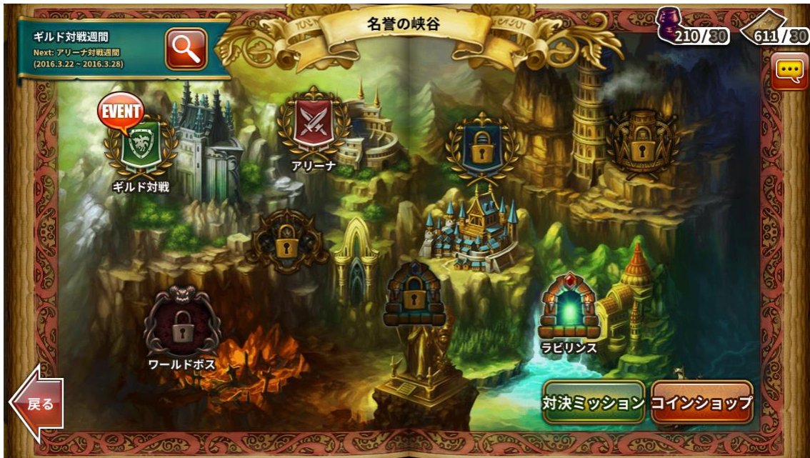
〈対決エリア「名誉の峡谷」〉

アリーナ、ギルド対戦、ラビリス、ワールドボスなどの対決・ランキング関連のコンテンツが新たに追加された「名誉の峡谷」のエリアに集結、各コンテンツで得られるコインで通常手にいられない特別アバターや装備などを交換することができます。さらにこのエリアでは対決ミッションが追加、各ミッションを達成することで、様々な報酬を獲得できます。