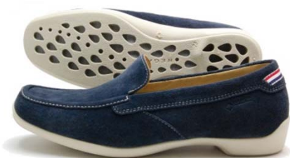
《REGAL F85C》 ※レディース カラー：レッド、グレー、ネイビー、 ダークブラウン、イエロー サイズ：22～25cm 販 路：全国のリーガルシューズ、百貨店、靴専門店