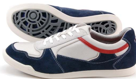
《REGAL 54FR》 カラー：ブラック、ライトグレー、ネイビー、 レッド、グリーン サイズ：23.5～27cm 販 路：全国のリーガルシューズ、百貨店、靴専門店