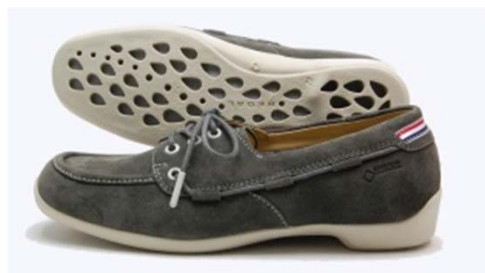
《REGAL F84C》 ※レディース カラー：グレー、レッド、ネイビー、 ダークブラウン サイズ：22～25cm 販 路：全国のリーガルシューズ、百貨店、靴専門店

【報道機関の方からのお問合せ先】GORE-TEX® FOOTWEAR PR事務局：(株)ゼスト 高橋、石田、寺田、小林 TEL：03-6426-5580 FAX：03-6426-5581 E-mail:PR-gore@zst-b.com