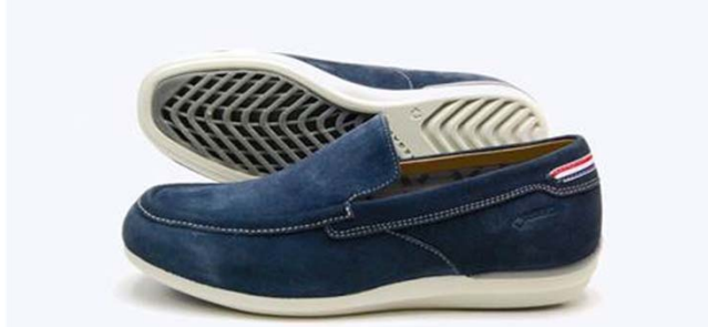
《REGAL 52FR》 カラー：ネイビー、ベージュ、グレー、 レッド、イエロー サイズ：23.5～27cm 販 路：全国のリーガルシューズ、百貨店、靴専門店