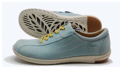
《REGAL WALKER HA53》 ※レディース カラー：アイボリー、ブルー、ブラウン、ブラック サイズ：22～25cm 3E 販 路：全国のリーガルシューズ、百貨店、靴専門店