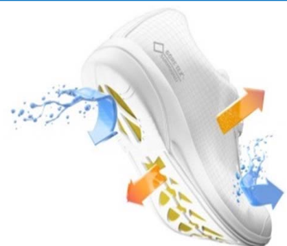
防水・透湿イメージ図

「GORE-TEX® SURROUND™ FOOTWEAR」は、ソール（靴底）にいくつものホール（穴）を開けることにより、360度全方位で防水・透湿機能を実現している点が特徴です。この画期的な360度防水・透湿機能により、アッパー部分だけでなくソールからも汗による水蒸気を逃がし、暖かい環境の中でもムレにくく、足をドライで快適な状態に保ちます。また、特徴的なソールのデザインは展開されるブランドにより様々で、さりげないファッションのアクセントとしてもお楽しみいただけます。暖かい気候や環境の中でも足は360度全方位快適でいられる最新鋭のフットウェアです。