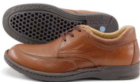
《REGAL WALKER 187W》 カラー：ブラウン、ブラック サイズ：23.5～27cm 販 路：全国のリーガルシューズ、百貨店、靴専門店