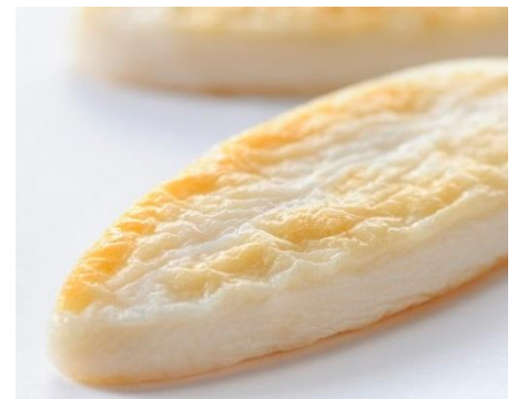
阿部の笹かまぼこ 1枚190円（税込）

今回新たに、かくし味として、特別な本醸造特級醤油を使用。職人が300通りのレシピから苦心して見つけ出した、魚の旨みが際立つ味わいです。