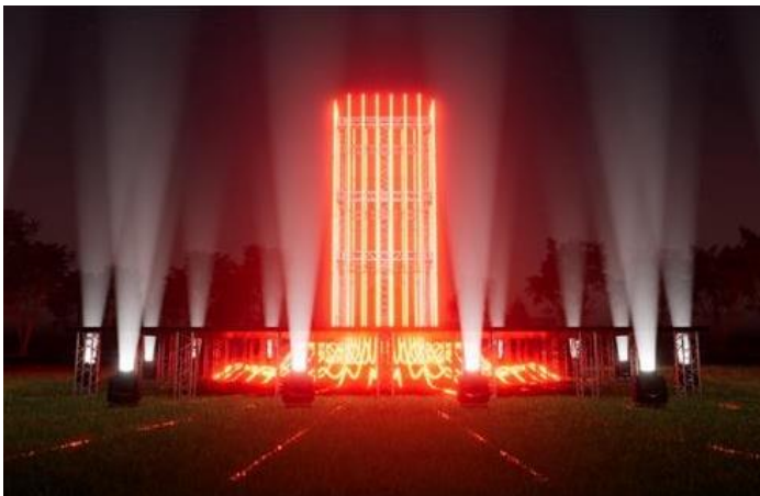
イメージ CG ◉MPLUSPLUS

独自開発の LED コスチュームをまとったダンサー「M++DANCERS」が最先端パフォーマンスを披露します。