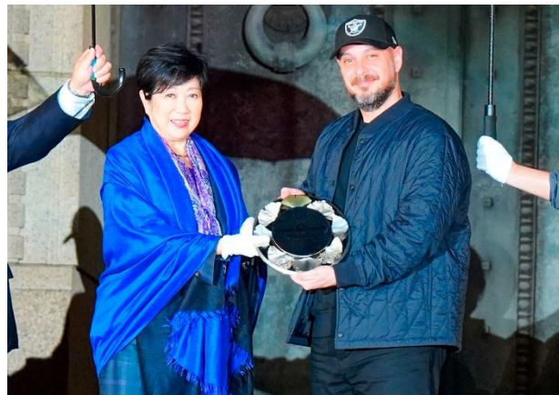
昨年度開催の様様