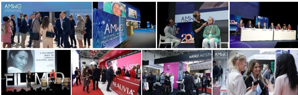
第 20 回 AMWC 2022 モンテカルロ モナコ 開催の様子

今年 20 回目の開催を迎えた「AMWC (Aesthetic and Anti-Aging Medicine World Congress)」は、毎年 3 月~4 月にモナコで開催され、世界各地から 12,000 名を超える参加者があり、250 社以上の美容医療関連の医薬品、医療機器及び化粧品・サプリメント領域の企業が出展しています。