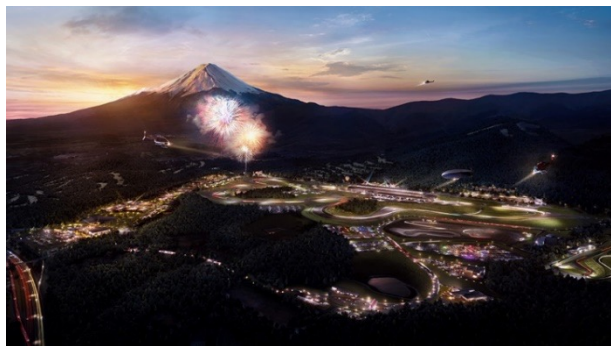
▲「富士モータースポーツフォレスト」イメージ

「富士モータースポーツフォレスト」は、トヨタ自動車株式会社、トヨタ不動産株式会社、富士スピードウェイ株式会社の3社が静岡県小山町において推進する新しいプロジェクトです。国際サーキット「富士スピードウェイ」を中心に、ラグジュアリーエクスペリエンスを提供する「富士スピードウェイホテル」、時代を象徴するレーシングカーを展示する「富士モータースポーツミュージアム」、国内有数のレーシングチームのガレージなど、モータースポーツ文化を楽しめる多彩な施設から構成されます。また、より多くの方に立ち寄っていただける温浴施設、レストランなども構想中です。