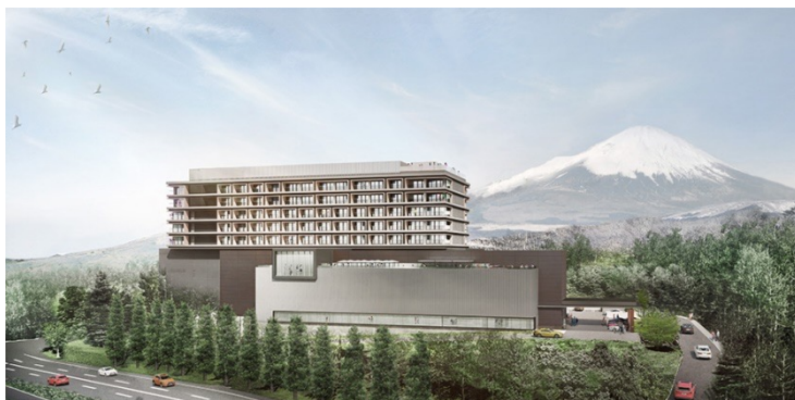
▲10月7日に開業が決まった富士スピードウェイホテル 外観