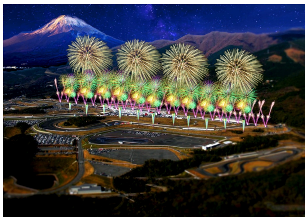
▲花火の打ち上げイメージ

富士山花火実行委員会は、2022年秋より順次オープンする「富士モータースポーツフォレスト」と連携し、「FUJI MOTORSPORTS FOREST Fireworks by 富士山花火」を2022年11月5日(土)に初開催いたします。