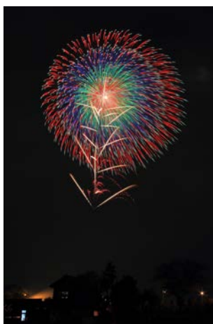
▲野村花火工業の花火