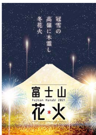
▲キーヴィジュアル

富士山花火実行委員会は、2021年12月18日(土)の第一回「富士山花火」開催に伴い、11月19日(金)17:00鑑賞チケットを発売いたします。また花火の製作には、すでに発表したイケブンに加えて、野村花火工業、片貝煙火工業も出演することが決定しました。