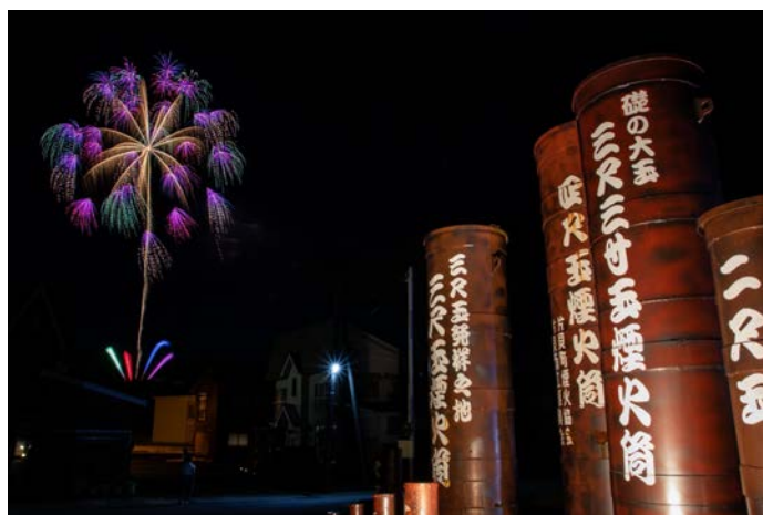
▲片貝煙火工業の花火