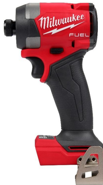
M18 FUEL インパクトドライバー

<製品購入や体験、お問合せ> ミルウォーキーツール・ジャパン合同会社 TEL: 03-6905-8040 https://www.milwaukeetool.co.jp/