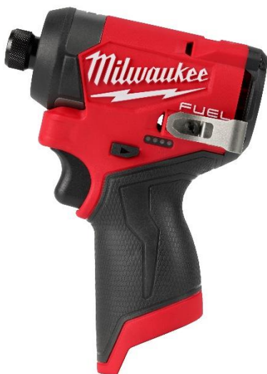
M12 FUEL インパクトドライバー