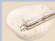
ガラクトミセス培養液 ※3