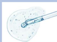
ナイアシンアミド ※2 高浸透 ※4 処方