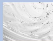
高浸透化 ※4 セラミド ※6