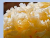
シロキクラゲ 多糖体 ※7