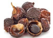
ソープナッツエキス ※1