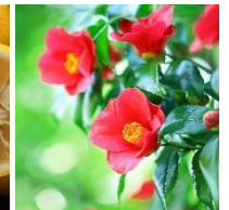
国産ツバキオイル※5