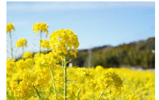
ナタネリペアショット※3

ナタネ種子から得られる毛髪補修成分。髪内外の「亀裂、に入り込んで留まり、ドライヤーやヘアアイロンの熱と反応して毛髪のタンパク質に結合。使うたびになめらかな質感へ。