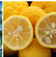
高知県産ユズ種子オイル※4