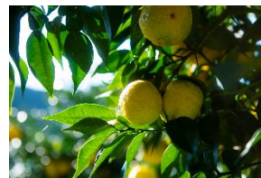
高知県産ユズ精油※6

アルジェランのヘアケア製品は香りの持続性を考え、天然精油を中心に合成香料をバランス良く組み合わせた「デュアルフレグランス、を採用。爽やかな高知県産ユズ精油※6と落ち着いたラベンダー精油※7を基調とした、アロマティックシトラスの香り。