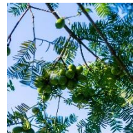
高知県産 KAYA オイル※2

高い保湿力をもつ高知県産 KAYA オイル※2を配合。髪になじみやすいさらさらの質感で髪1本1本をうるおいで包み込み、乾燥を防ぎます。さらに高知県産ユズ種子オイル※4と国産ツバキオイル※5がキューティクルをコーティングし、摩擦による「亀裂、の進行を防ぎます。