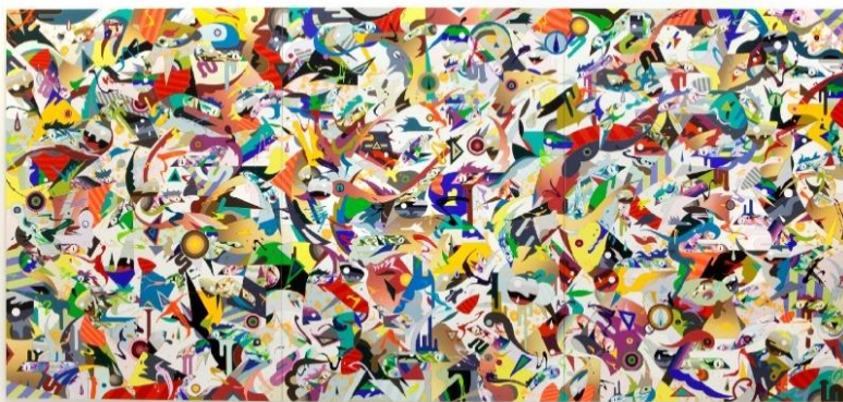
松山智一 《Keep Fishin' For Twilight》2017 H213.5 x W457.5 cm Acrylic and mixed media on canvas