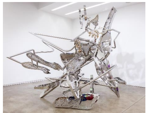
松山智一 《Dancer》2022 H339 x W360 x D359 cm Stainless Steel