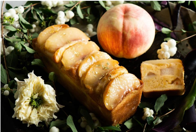
(とろももパウンドケーキ)