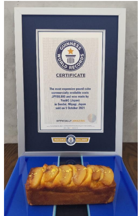
(公式認定ととろももパウンドケーキ)