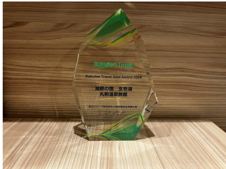
▲「楽天トラベルアワード」受賞のトロフィー