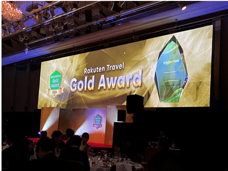
▲「楽天トラベルアワード」表彰式の様子