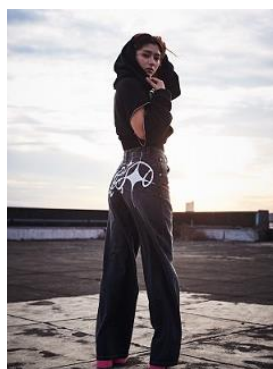
パーカー ¥13,200(税込) デニム ¥23,100(税込)