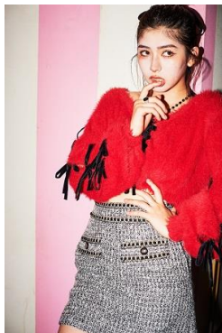
ニット ¥11,000(税込) スカート ¥12,100(税込)