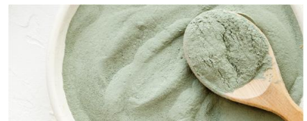
厳選されたクレイを使用

保湿力のあるアミノ酸ベースのやさしい処方。毛穴の奥の汚れまでしっかり吸着し、やさしく洗い上げます。