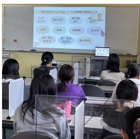
《 授業の様子 》

ミュゼホワイトニングでは、長引くマスク生活により、口元周りのトラブルや悩みが増加していることから、中央医療専門学校 太田校にて「小顔音読」を題材にしたオンライン授業を7月1日（木）に開催いたしました。「小顔音読」はマスク生活で“会話が前より減った”、“無表情の時間が増えた”、“口角が下がった”といったトラブルに対する解消法を著した本です。この「小顔音読」をもとに、当日は、歯科医師や歯科衛生士の目線で考案した口腔ケア方法をはじめ、口呼吸や口輪筋のゆるみなどを改善する口元や顔のインナーマッスルの鍛え方、気軽にキレイを目指せる方法を伝授しました。