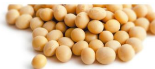
特殊な製法で抽出したダイズエキス