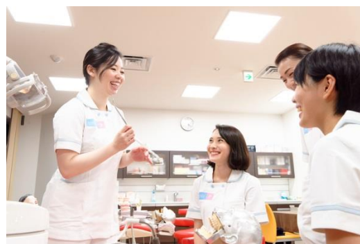
学生たちから人気の審美ゼミ・ホワイトニング実習