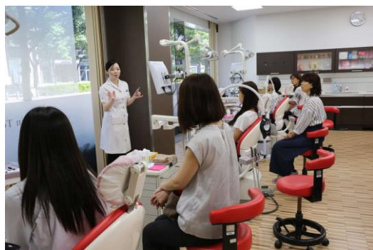
オープンキャンパス 親子でホワイトニング体験の様子

▶歯科衛生士科の学科紹介についてはこちら： https://www.dh.ntdent.ac.jp/department