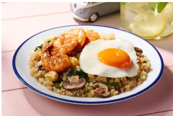
▲「Kit Oisix／ハワイのロコ定番！フライドライス」

URL: https://www.oisix.com/sc/hawaii2025