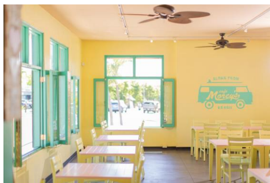
▲「カフェ・モーリーズ」店内の様子。パステル調でオープンエアのおしゃれな店内は、居心地も抜群

一方、2018年ホノルルにオープンした「PARIS.HAWAII」は全米新聞「USA Today」によるニューレストランTop10にハワイ史上初のノミネート。全米5位に入賞の実力店です（2024年12月ホノルル・カカアコ地区に移転オープン予定）。ハワイアンBBQ、鮮やかなカラーのサラダが登場。ご自宅の食卓でハワイを満喫いただけるミールキットをご用意しました。