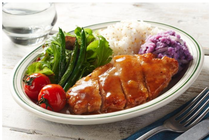
▲「Kit Oisix／ハワイアンBBQポークプラッター」