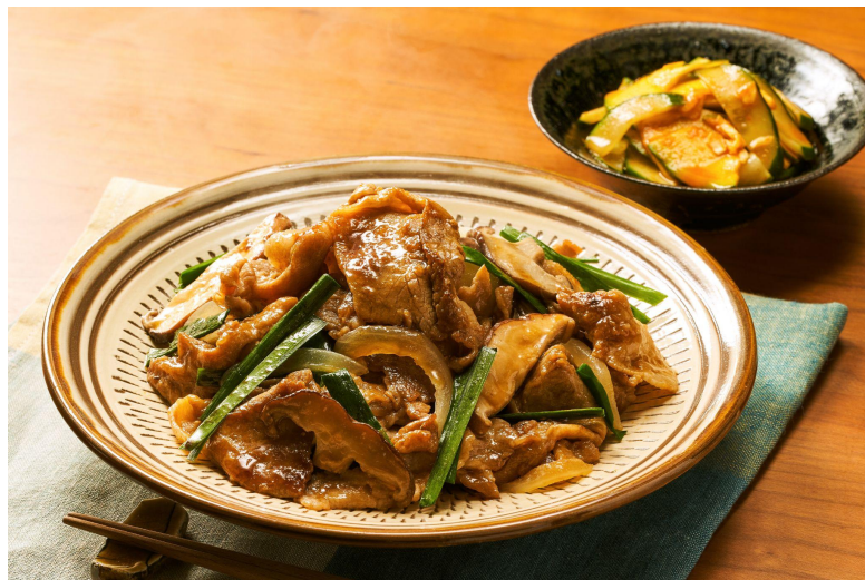
▲Kit Oisix「豚肉とニラの手作り香味だれ炒め」