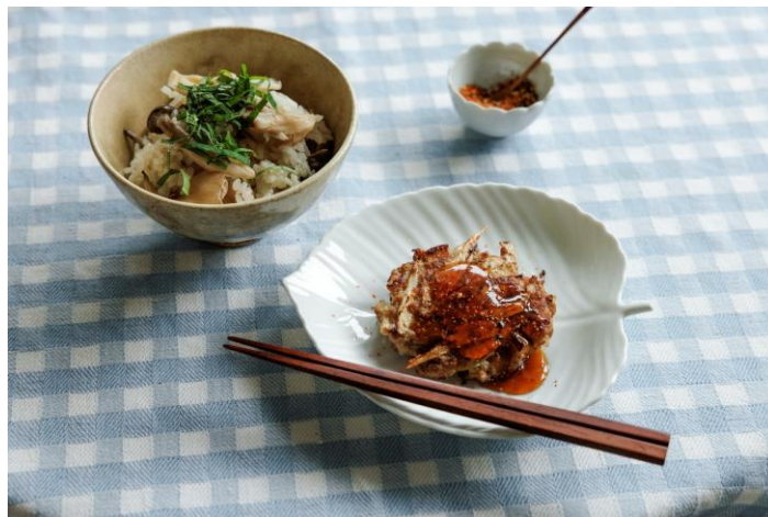
▲もっとうれしい週末ごはん ごぼうハンバーグ