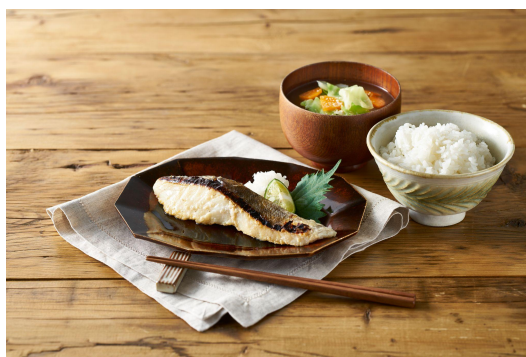
▲北海道根室産真鱈塩麹漬け

また、無漂白・無着色で仕上げた栗にお出汁を合わせた「栗ごはんの素」など、季節のメニューもご用意しています。