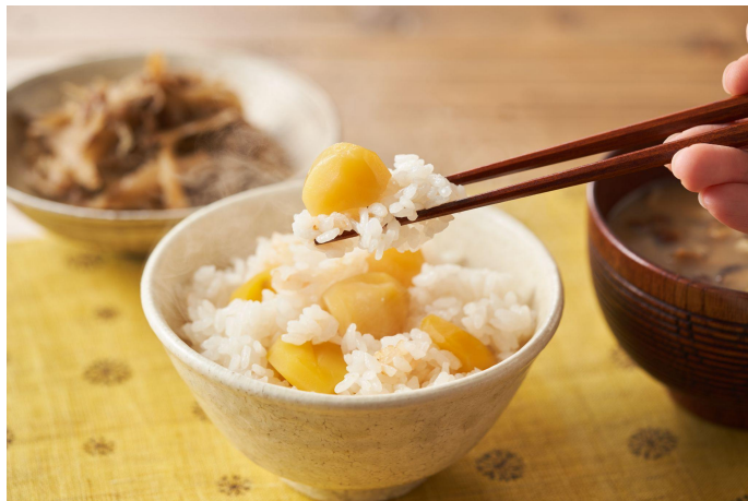
▲【無漂白】だし香るゴロっと栗ごはんの素

小麦を中心に食品価格の高騰が相次ぐ中、当社が実施したアンケートでは「今年4月以降お米を食べる機会が増えた」という回答が7割を超える結果となっており、価格が据え置かれているお米回帰が進んでいます。