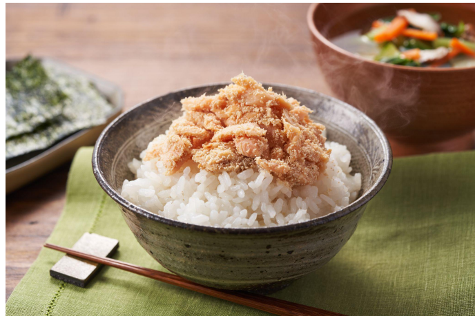
▲ごはんすすむ！北海道産焼き鮭たらこ和え