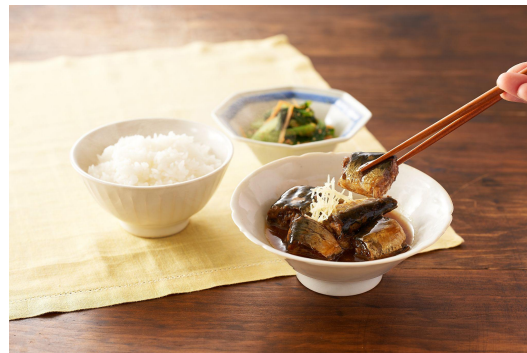
▲骨までまるごと！浅炊きいわし