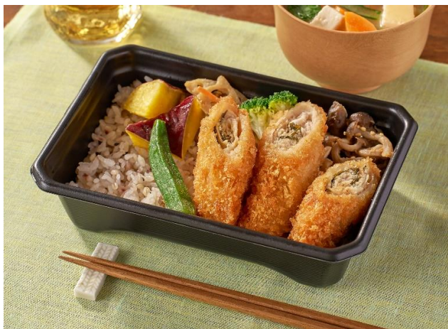
▲大戸屋 梅しそ巻きカツ弁当