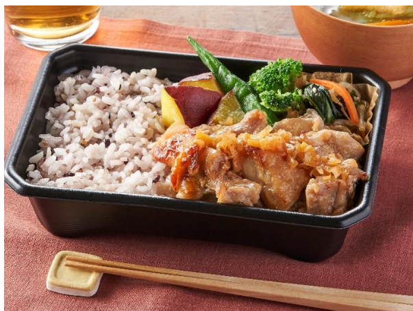
▲大戸屋 醤油麹チキンの香味ねぎ