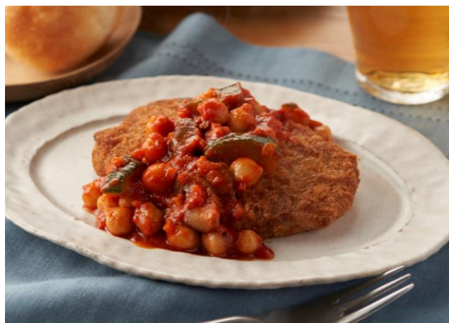
▲かつとゴロゴロ野菜トマトソース