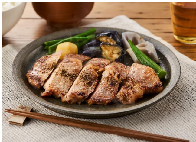
▲山椒香る 味噌漬け豚のソテー