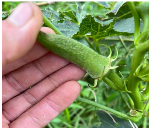
▲台風12、14号を耐えたオクラ(沖縄県産)

販売ページURL: https://www.oisix.com/sc/otasukeoisix