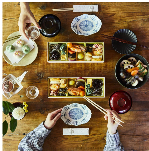
▲「国産素材の食べきり銘々重 さくら」 (大地を守る会)