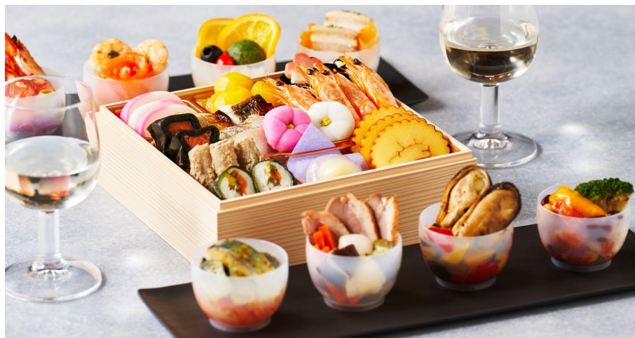
▲「宝華」(Oisix)※スタイリングイメージ

新作として、SNSへの投稿アレンジがしやすいスタイリングできるおせちや、近年増えている単身・2人暮らし世帯でそれぞれが自分の好きなタイミングでお召し上がりいただけるおせちを提案します。