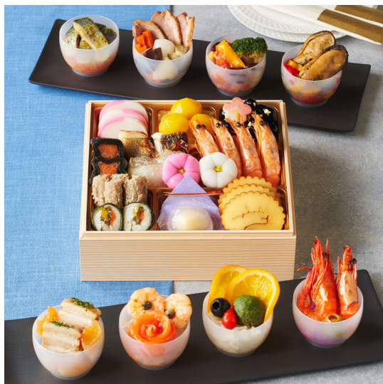
▲「宝華」(Oisix) ※スタイリングイメージ