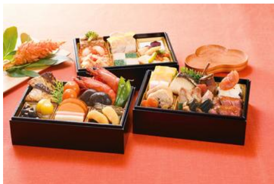
▲和洋おせち「上慶福」(らでいっしゅぼーや)

URL: https://www.oisix.com/sc/osechi2023