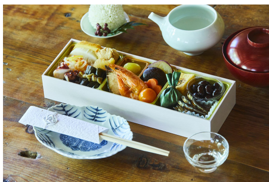
▲「国産素材の食べきり銘々重 さくら」 (大地を守る会)

URL: https://www.radishbo-ya.co.jp/rb/osechi/regular/